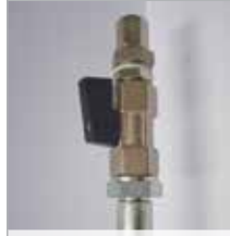
Ventiel aan het eind van de slang: open