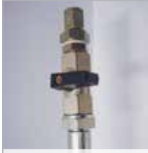
Ventiel aan het eind van de slang: gesloten